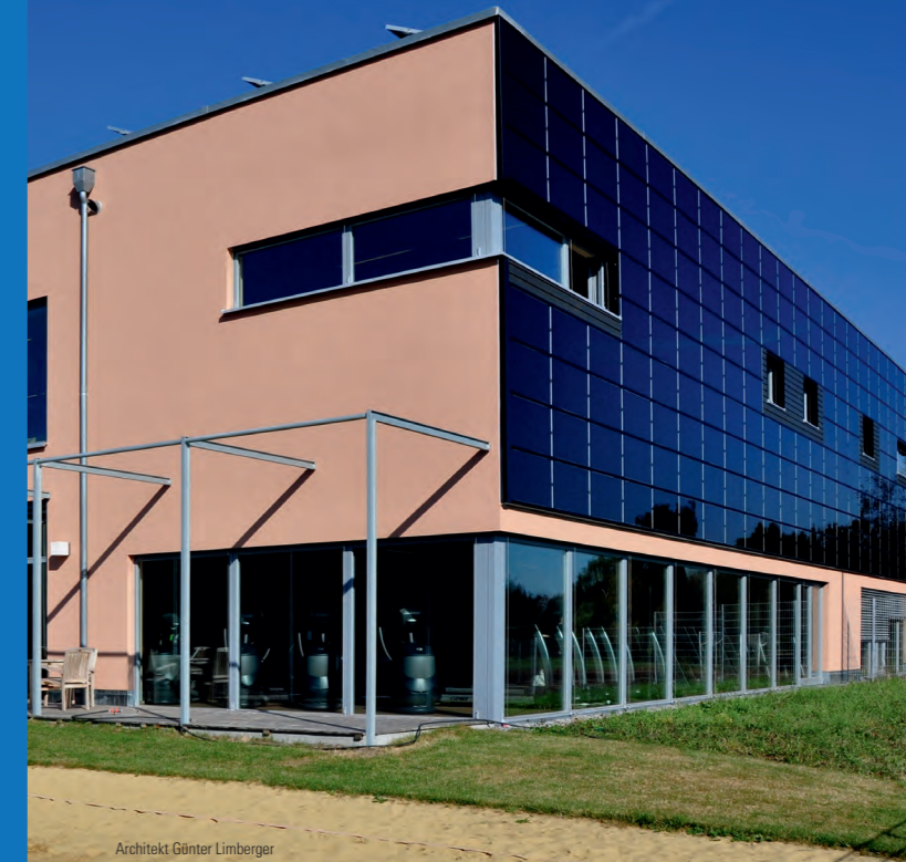
Architekt Günter Limberger