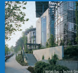
Verlag Bau + Technik GmbH

Organisationsbüro: FORUM ZUKUNFT ENERGIE c/o Akademie der Ingenieure AkadIng GmbH Gerhard-Koch-Straße 2, 73760 Ostfildern Telefon 0711 79 48 22-21, Telefax 0711 79 48 22-23 kontakt@forum-zukunft-energie.de, www.forum-zukunft-energie.de