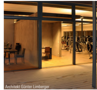
Architekt Günter Limberger

Dieses Forum „Energieeffizienz in KMU“ zeigt anhand konkreter Fragestellungen Wege und Lösun- gen auf, um Einsparpotenziale im Betrieb zu analysieren und Ansätze